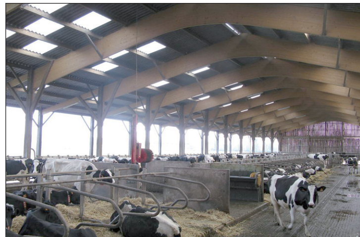
Les producteurs laitiers avec des aires raclées sont les principaux concernés.

Si le résultat montre des capacités insuffisantes par rapport à celles requises, je prends contact avec un conseiller spé-