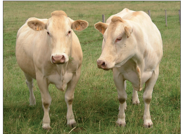
Les écarts de poids au sevrage des brouillards adhérents à Bovins Croissance sont supérieurs de 15 kg, soit 35 à 40 € par animal.

Bovins Croissance est un investissement. La valorisation de