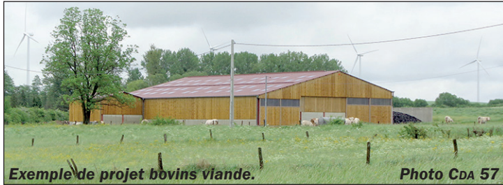
Exemple de projet bovins viande.