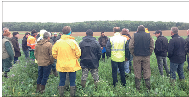
Les agriculteurs sont venus en nombre visiter la plateforme d'intercultures.

plus de 230 participants, - 6 rencontres techniques en partenariat avec les autres structures du territoire (CUMA et Syndicats de rivière) touchant plus de 130 agriculteurs,