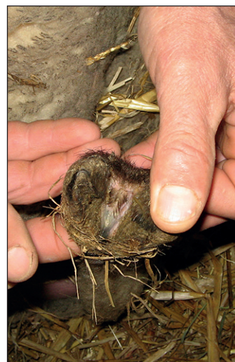
Dans un premier temps, la maladie se déclare par une inflammation.

tir contaminées. Les litières humides sont également un fac-