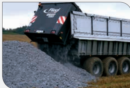
Boues de papeterie

A noter, le ratio boue compostée / boue épandue sur plan d'épandage est de 45/55.